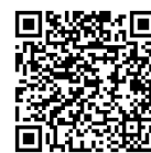
新入生健康診断ページ

注意）回答完了後に健診の予約画面となりますが、予約は取らずに上記 3. 対象学部と日時で指定された日程で受検してください。